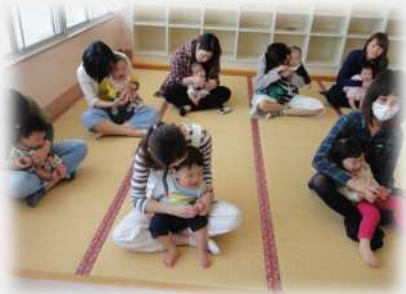
ベビーマッサージ